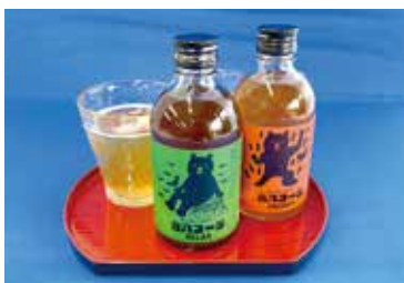
喜八コーラ ENRGY RELAX