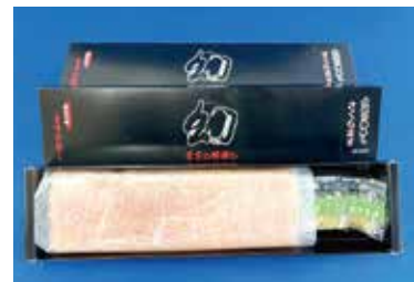
立山山麓の 幻さくらます寿し