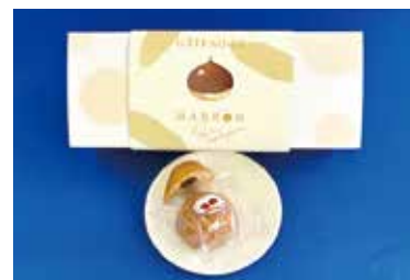
栗のフィナンシェ