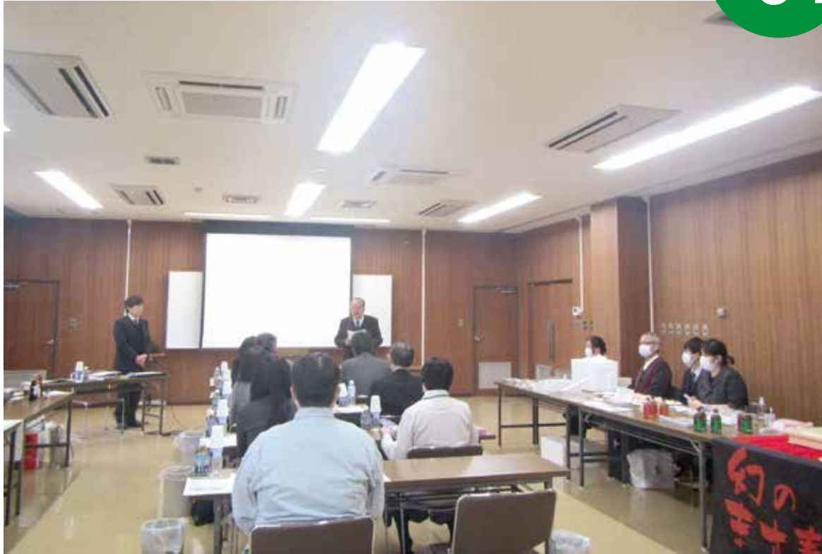
地域食品評価会 審査風景