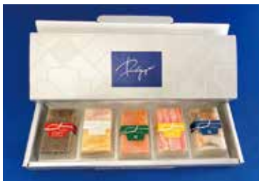
冷凍押し寿司 Rejyu(レジュウ)