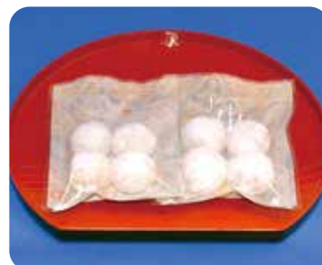
「きびスノーボールクッキー」