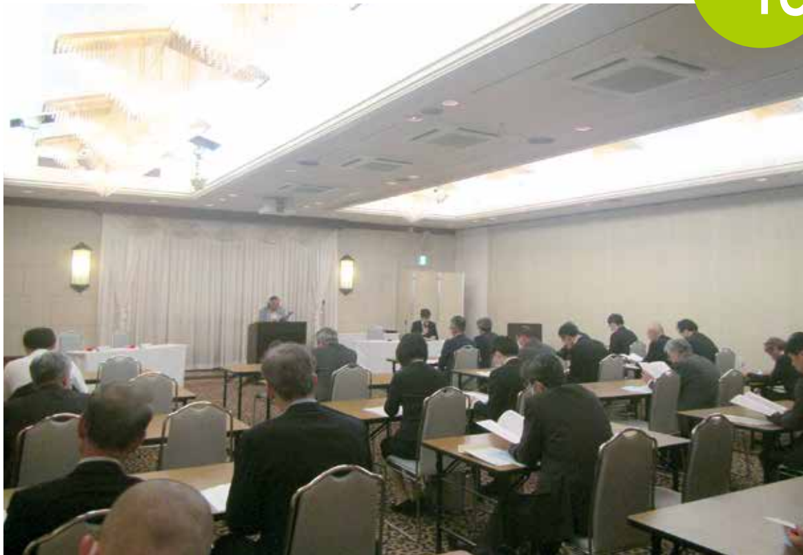
令和5年度 通常総会