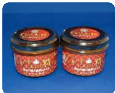
「食べるにんにく糎(辛口)」