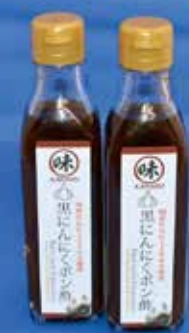
「黒にんにくポン酢」