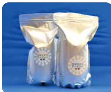
「ななぴかりヨーグルト」