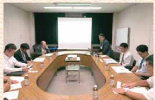
とやま醸造・発酵オープンラボ利活用に関する意見交換会