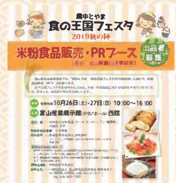
食の王国フェスタ