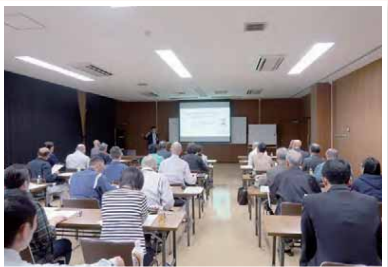
業種別HACCP導入支援研修会（生めん製造）