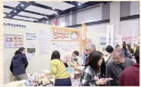
米粉食品販売・PRコーナー