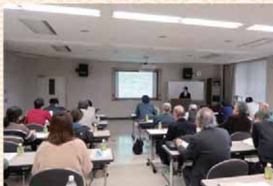
業種別HACCP導入支援研修会（豆腐製造）

日 時：令和元年11月18日（月） 場 所：富山県農業総合研修所 参加者：19名